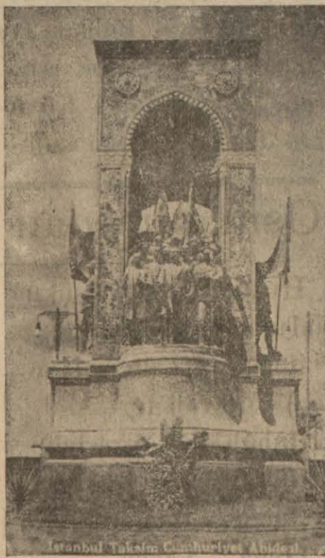
Istanbul Cumhuriyet âbidesi

İSTANBUL, 16 (A.A)—Madam Hada Şaravi Paşanın Riyasetinde Madam Emine Sultan, Madam Mehmet Ali, Seza, Nabara, Huriye, Havva İdris gibi Mısırın mümtaz kadınlarından müteşekkil Mısır kadınlar heyeti dün sabah saat 11 buçukta Taksim Meydanına giderek Cumhuriyet Âbidesine bir çelenk koymuştur. Bir polis müfrezesinin de hazır bulunduğu bu merasim esnasında Madam Şaravi Paşa şu nutku söylemiştir :